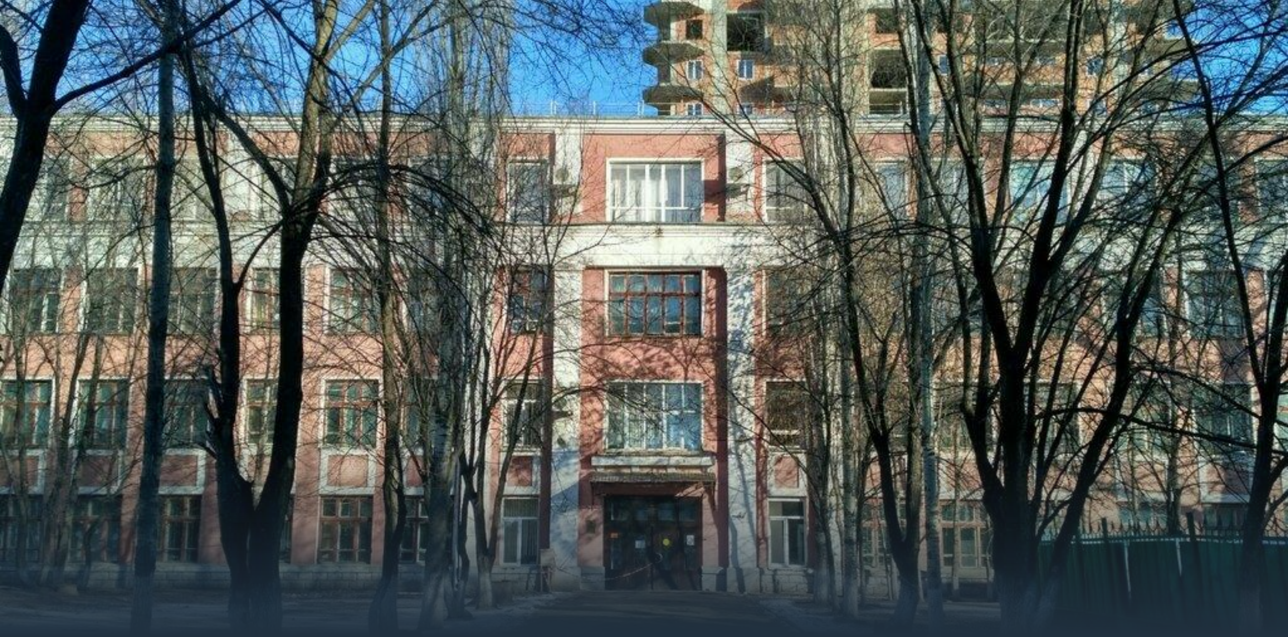
учебный корпус: Ильинская площадь, 4